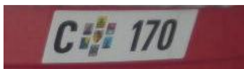
"CONTRASSEGNO LAGO CERESIO"

PER LA NAVIGAZIONE NELLE ACQUE TERRITORIALI DEI DUE STATI CONTRAENTI (ITALIA E SVIZZERA) I NATANTI DI LUNGHEZZA SUPERIORE A METRI 2,50 DEVONO ESSERE MUNITI DEI DOCUMENTI DI BORDO E CONTRASSEGNI SECONDO I RELATIVI ARTICOLI DEL REGOLAMENTO, FATTE SALVE LE ECCEZIONI IN ESSO PREVISTE. [ART. 4 CPV 3 - CONVENZIONE 2 DICEMBRE 1992]